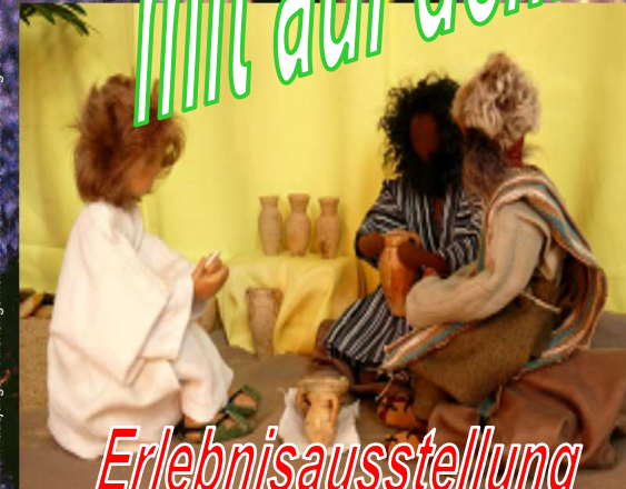
"Emmausjünger" Kirchengemeinde St. Markus, Braunschweig-Südstadt